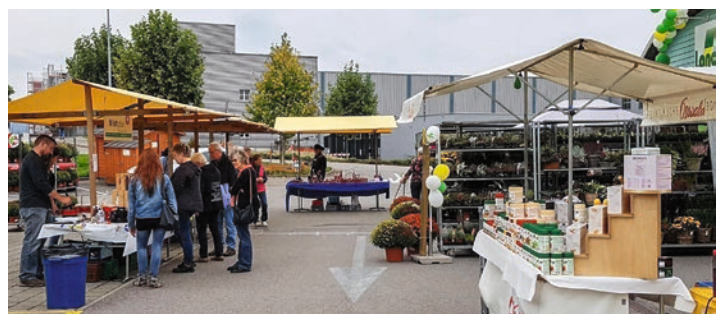
Un marché paysan a été organisé le samedi.

JEGENSTORF/BE Il y a dix ans, l'ancienne LANDI Grauholz inaugurerait un nouveau site à Jegenstorf. Le terrain de Bernfeld accueillit à cette occasion un magasin LANDI et une station-service équipée d'un TopShop. Les magasins LANDI implantés sur les anciens sites à Hindelbank et au centre du village de Jegenstorf cessèrent alors leur activité. Les dix ans de la LANDI ont