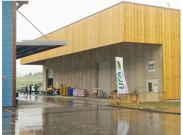
La nouvelle halle Agro de Courtelary a été inaugurée.