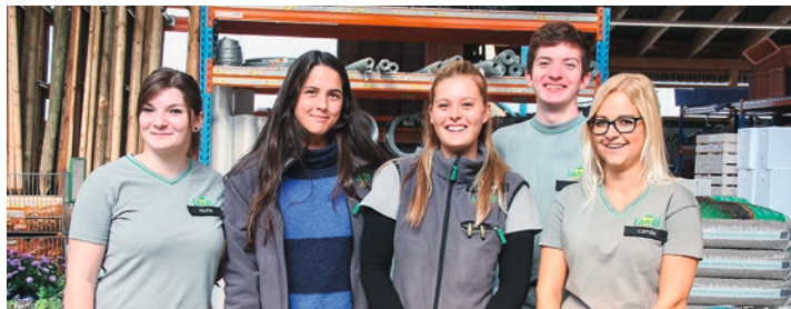
Les apprentis de la LANDI Moudon.