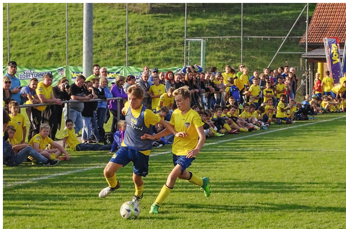
Quelque 600 enfants de 57 villages de Suisse ont participé au tournoi Volg des villages qui s'est déroulé en 2017.

Steinen SZ et Schnottwil SO s'est soldée par la victoire indiscutable de l'équipe de Steinen. La troisième place a été remportée par