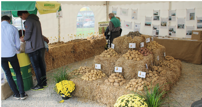
La grande exposition spéciale a permis de présenter plusieurs variétés de pommes de terre et leur mise en valeur.

terre. Les producteurs étaient également invités à apporter les pommes de terre les plus difformes qu'ils avaient récoltées, dans la perspective d'un autre concours. La LANDI a proposé de nombreuses autres attractions, telle une installation à câble de 300 m de long qui permettait de s'élancer à grande vitesse à partir du silo à céréales de 40 m de haut. Près de 400 personnes de tout âge (autorisé) ont fait preuve de beaucoup de courage pour tenter cette aventure très spéciale. LANDI Weinland réceptionne des volumes de pommes de terre conséquents. Elle dispose de stocks de vrac et de palettes importants et d'une infrastructure ultra-moderne pour la reprise, le tri et l'emballage de plus de 10000 t de pommes de terre.