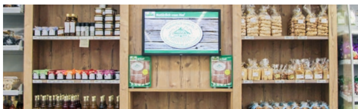
Stand «Naturellement de la ferme» à Châtel-St-Denis.

gasin. Dans certaines de ces zones, les clients disposent d'un écran de type iPad leur permettant d'obtenir des informations détaillées sur certains produits. Le concept 2.0 a aussi permis de créer une zone spécifique réservée aux produits locaux avec le stand «Naturellement de la ferme», où sont notamment proposés des bricelets, des caramels, du miel ou des œufs. L'écran intégré au stand permet à la clientèle de se faire une idée des exploitations qui livrent ces produits locaux.