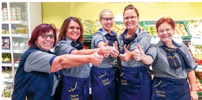
L'équipe du magasin Volg de Römerswil.

tion. Les clients disposent d'horaires plus flexibles, le magasin étant désormais ouvert durant la pause de midi et le mercredi après-midi.