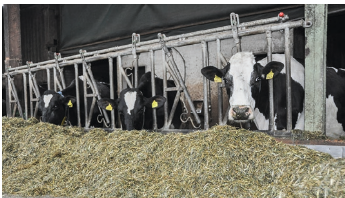
fenaco propose une large palette de produits bio.

Chez fenaco, le secteur bio est particulièrement développé au sein de l'unité d'activité UFA. Une part importante des aliments UFA est commercialisée en bio, ce qui s'explique notamment par la croissance du bio dans les secteurs bovin et avicole. Dans la division Agro, la part du chiffre d'affaires réalisée en bio atteint un pourcentage moyen à un chiffre et affiche un solide taux de croissance. Tout porte à croire que la demande en produits bio va continuer à augmenter. Le nombre d'exploitations certifiées selon les directives de Bio Suisse a augmenté et s'élève désormais à 6144 unités (sur un total de 53 000 exploitations). Cette tendance est surtout favorisée par le commerce de détail et la hausse constante de la demande en produits bio.