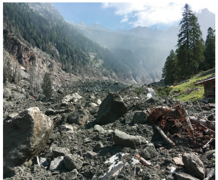
L'éboulement de Bondo a balayé l'alpage.

octroyée doit être apporté par la LANDI ayant fait la demande, fenaco se chargeant des deux tiers restants.