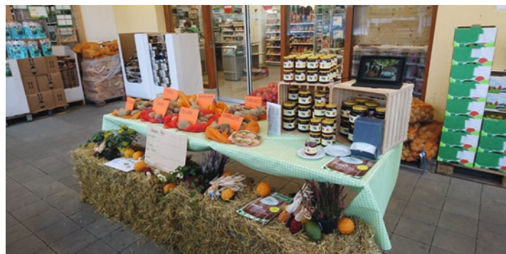
Les producteurs ont présenté leurs produits dans les LANDI.

DOTZIGEN/BE La seconde édition de la journée «Naturellement de la ferme» s'est déroulée le 21 octobre 2017. Les clientes et les clients qui se sont rendus dans un magasin LANDI ce jour-là ont assisté à une journée marquée par la présence des nombreux agricultrices et agriculteurs venus présenter leurs produits. Les clients avaient bien entendu la possibilité