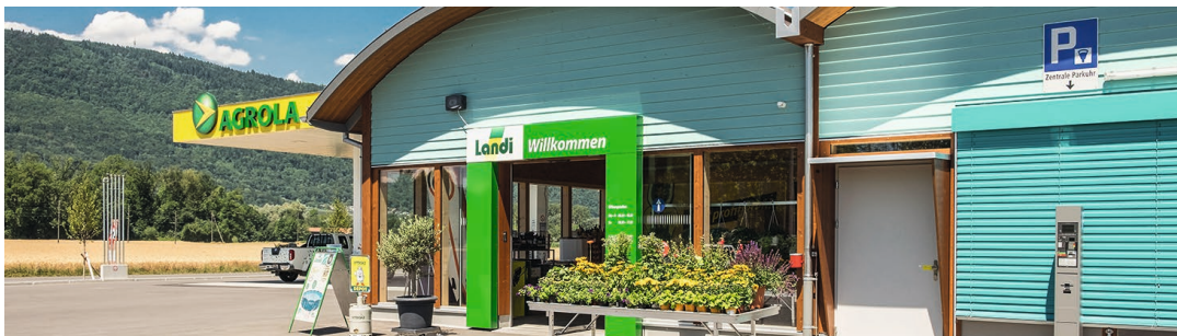
LANDI a obtenu la note globale de 4,97 et s'est ainsi hissée à la 17 e place du classement pour le bien commun.

Volg a obtenu une note générale de 5,03 et LANDI de 4,97. Au sein de la branche, ils sont placés derrière Migros et devant Coop. Ces résultats sont très réjouissants et attestent la bonne réputation dont jouissent les deux unités d'activité de fenaco auprès de la population suisse. En mars, LANDI s'était déjà hissée au 11 e rang du classement des entreprises suisses renommées. Les résultats détaillés concernant le classement en termes de «bien commun» peuvent être consultés sur le site http://www.gemeinwohl.ch/fr/