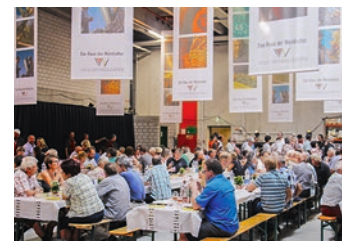
La visite a été suivie d'un apéritif et d'un succulent repas.