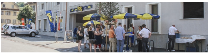
Les invités ont été nombreux à participer à l'inauguration du nouveau bâtiment Volg.