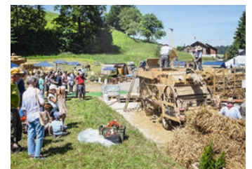
Les visiteurs ont profité des nombreuses attractions proposées dans le cadre de la fête d'anniversaire.