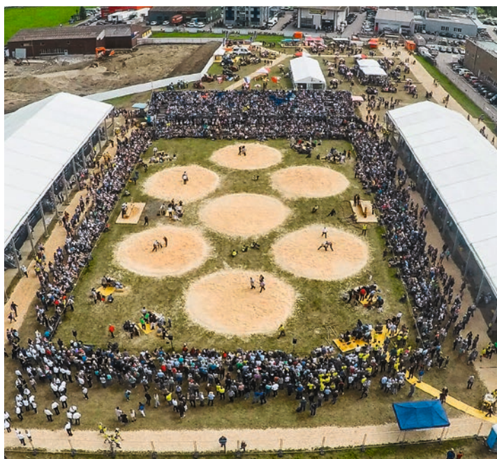
La fête de lutte lucernoise à Malters a attiré plus de 6000 spectateurs.