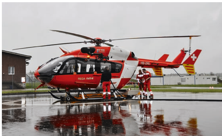
Plusieurs participants ont pu assister au retour d'un hélicoptère après une intervention.

L'équipe de la Rega est capable de décoller en moins de cinq minutes. Outre les hélicoptères qui ont fait sa réputation, la Rega dispose également de plusieurs avions qui sont équipés comme une station de soins intensifs à l'hôpital. Ces avions servent à secourir des membres ou des donateurs lorsqu'ils ont été victimes d'un accident à l'étranger.