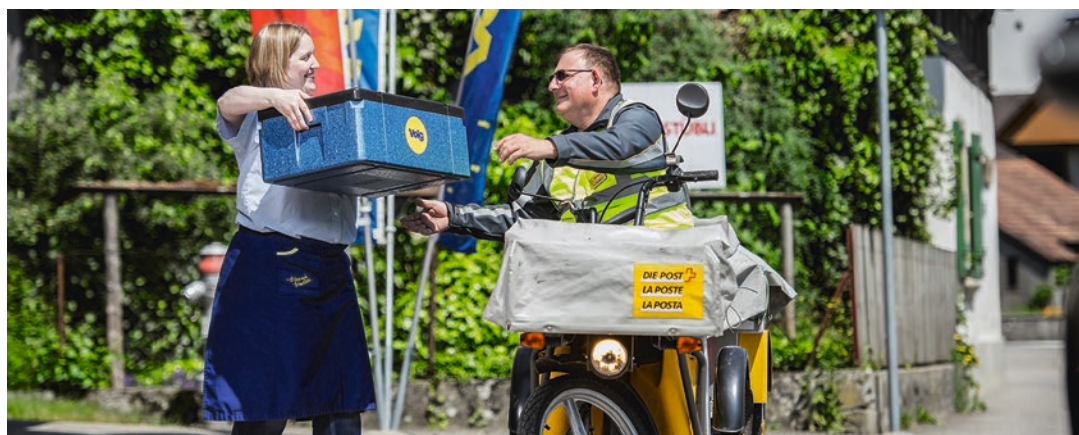
Le facteur va chercher la commande chez Volg et la livre sur le pas de la porte.

Vous trouverez des informations plus détaillées sous www.volgshop.ch