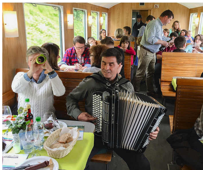
Ambiance détendue dans la cave mobile.