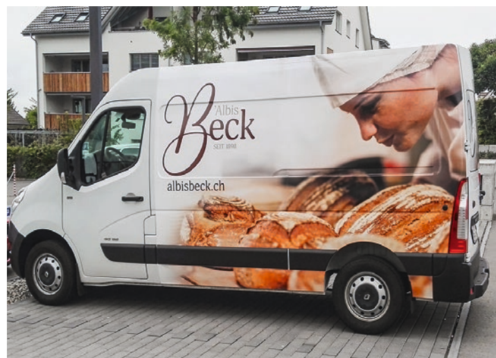
La «Volg Bäckerei Mettmensstetten» s'appelle désormais «Albis Beck».

les coopératives étaient mécontents des moulins de l'époque, ce qui les incita à fonder leur propre boulangerie coopérative.