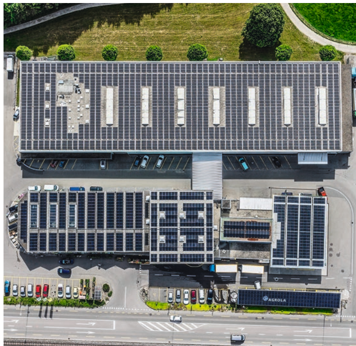
«Qui pense énergie, pense Agrola»: cela vaut également pour les installations photovoltaïques.

dont disposent les collaborateurs LANDI spécialement formés à cet effet nous permettent de proposer un service encore plus performant.» Les mesures de marketing et de communication du canal LANDI sont réalisées directement par Agrola. Les collaborateurs LANDI sont en contact direct avec leurs clients. Dans un premier temps, les collaborateurs en question peuvent donc évaluer les avantages qu'il y aurait à poser une installation photovoltaïque sur le site envisagé. La planification, le devis et la facturation sont effectués par Solvatec. Cette décision s'applique exclusivement à la présence commerciale de Solvatec au sein du canal LANDI. Les projets d'innovation, les projets-pilotes ainsi que les clients à fort potentiel continueront à être servis par Solvatec, explique Alexander Streitzig.