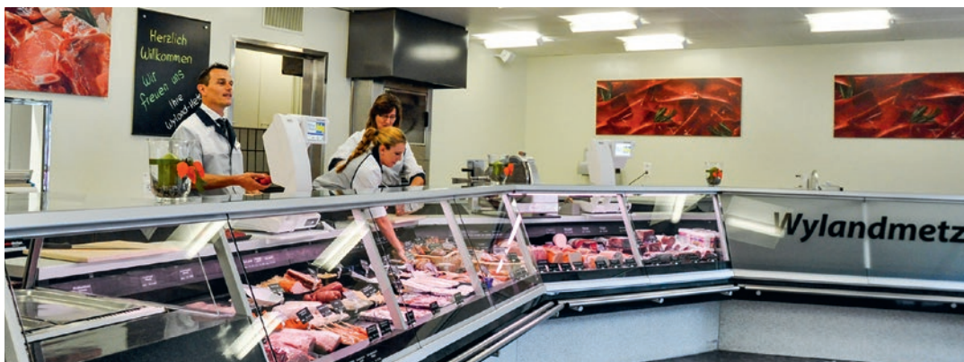
La boucherie d'Andelfingen a été rénovée et rouverte par la LANDI.

Le 8 octobre, les 44 membres de la LANDI ont été invités à un apéritif destiné à marquer l'ouverture de la boucherie. A cette occasion, une saucisse a été offerte à tous les membres et à la clientèle.