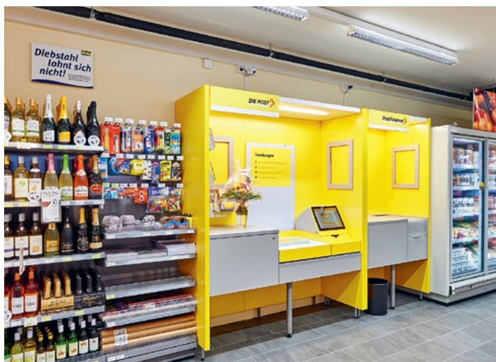
Guichets postaux dans des magasins Volg, comme à Freienstein (ZH).

La clientèle pourra ainsi réaliser ses opérations postales dans le cadre des horaires d'ouverture de son magasin Volg, de 6h à 19h, ceci sur un seul site qui est ouvert bien plus longtemps que l'agence postale actuelle. «Il s'agit d'un élément particulièrement important pour les