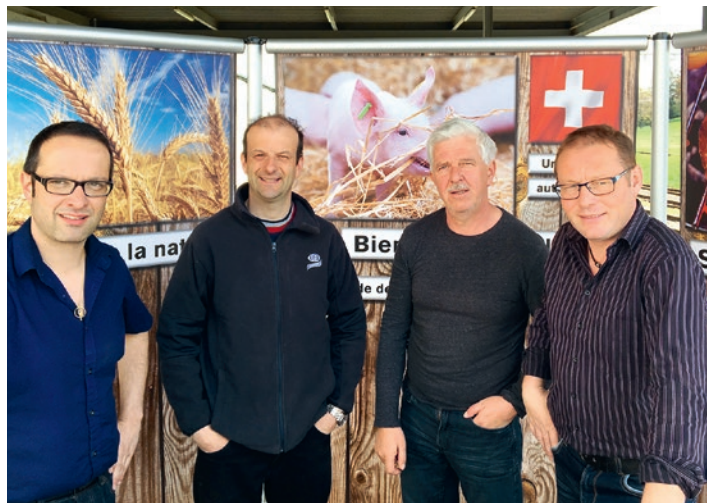
Les organisateurs de l'événement en faveur de la viande de porc.

Cette action était complétée par la présence d'un producteur de porcs et par la présentation de films sur la production porcine.