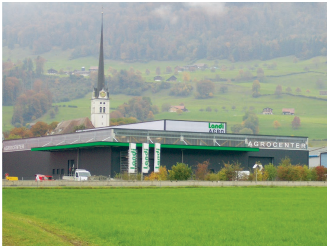
La halle Agro a été conçue de manière à satisfaire les clients et les fournisseurs.