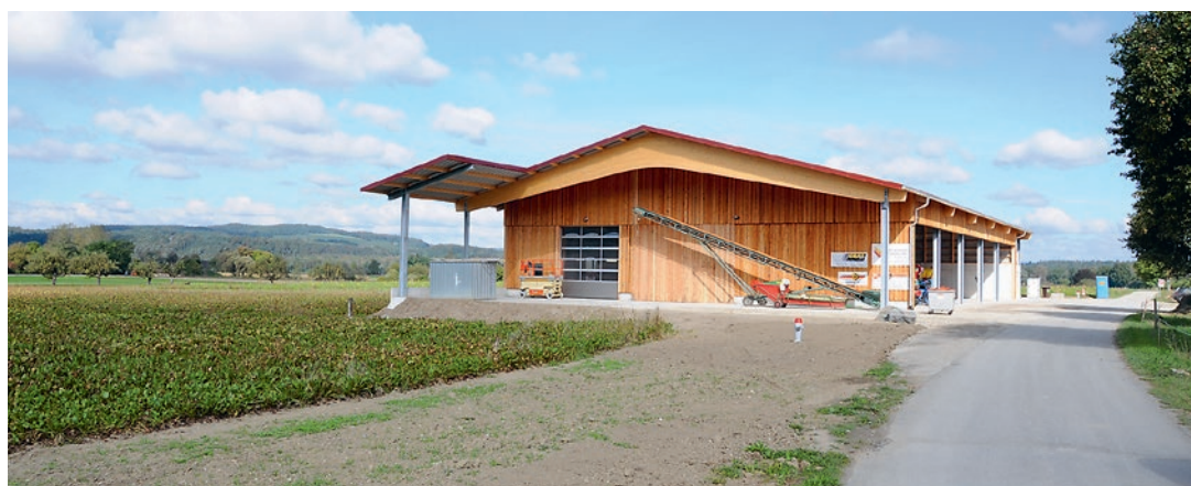
Grâce à la construction de la nouvelle halle à machines, le trafic agricole a fortement diminué au centre du village de Flaach.

ture du centre de recyclage de la commune de Flaach. A cette occasion, les personnes présentes ont pu visiter la halle, les machines et le centre collecteur. Les festivités se sont prolongées par une verrée conviviale.