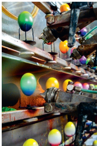
Chez Eico, la peinture des œufs durs est entièrement automatisée.