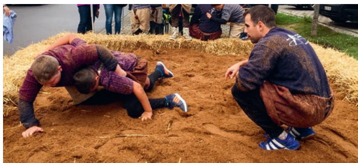
Initiation à la lutte lors de la fête d'automne de Klingnau.

le club de lutte de Zurzach a organisé un concours de lutte entre jeunes, permettant ainsi aux en-