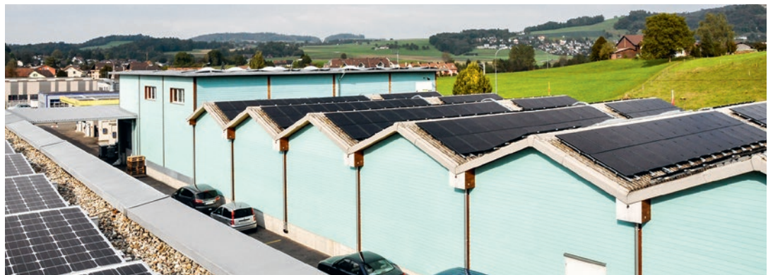
Solvatec SA a récemment installé des panneaux photovoltaïques sur les toits de la station-service, du TopShop et du magasin LANDI.