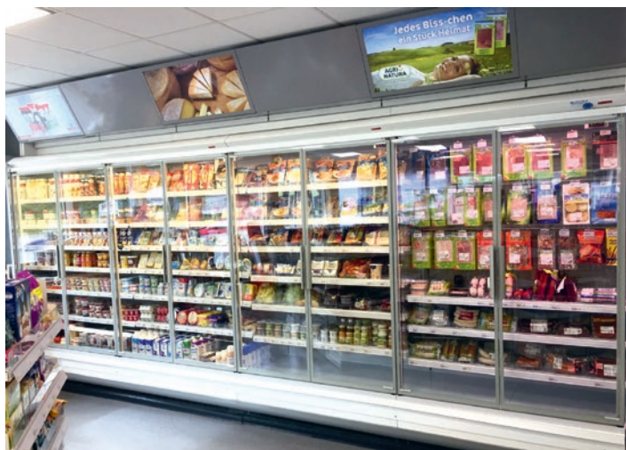
Autre projet réalisé récemment à la LANDI Zola SA: des portes pour les installations de froid du TopShop Bauma.

L'abaissement de la température de nettoyage des installations de lavage manuelles de 60°C à 35°C a par exemple permis de réduire le facteur énergétique de la LANDI d'environ 25 000 francs par an. La qualité de lavage n'a pas baissé pour autant, comme le confirment plusieurs collaborateurs. Mais comme la LANDI Zola SA réchauffe cette eau de lavage avec la chaleur produite par les installations de réfrigération du Shop, reste à savoir à quoi pourrait être consacrée la chaleur en question. «Plusieurs solutions sont envisagées», précise le