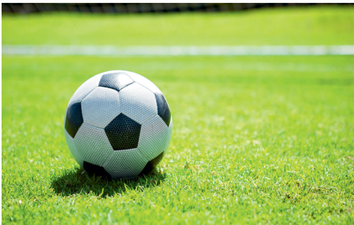
Les terrains de foot doivent être praticables rapidement par les joueurs. On a dès lors souvent recours à des gazons de placage.

Le gazon d'un terrain de foot habituel tel qu'on le trouve dans les stades se compose de quelque 200 millions de brins d'herbes. Les exigences envers un tel terrain sont tout aussi élevées que les attentes envers les professionnels qui y jouent. Même dans les conditions les plus difficiles, le gazon doit tenir et rester non glissant tout en conservant sa couleur verte. Après des