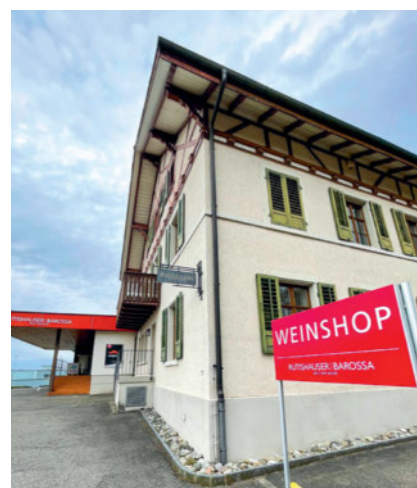
La boutique de vin très appréciée de Scherzingen sera conservée.

ter. DiVino, une marque encore jeune, apportera une touche de modernité à l'entreprise. ■