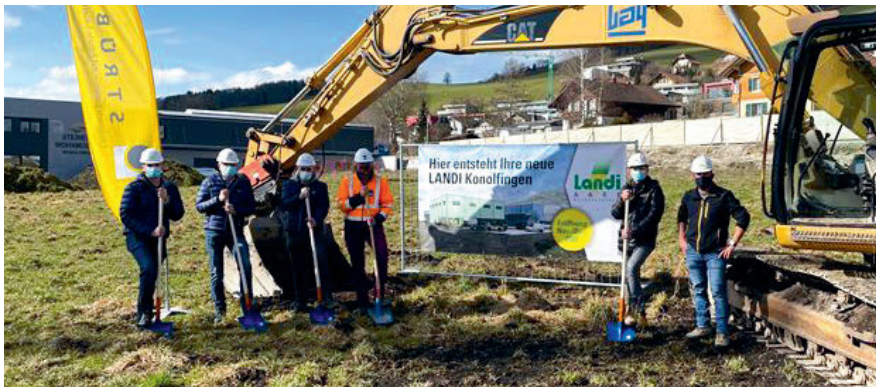
Des représentants du Conseil d'administration et de la Direction de LANDI Aare, ainsi que des représentants de Strüby Konzept AG et de C. Bay AG ont participé au traditionnel premier coup de pelle.

au rez-de-chaussée est prévue pour le mois de décembre 2021. Sa surface totale de 805 m 2 comprendra un large assortiment qui prend en compte l'évolution des besoins de la clientèle régionale. Les 49 places de parc gratuites permettront aux clients de faire leurs achats confortablement. Une installation photovoltaïque de 60 kW a été posée en toiture. Le courant ainsi produit est consommé directement sur place. ■