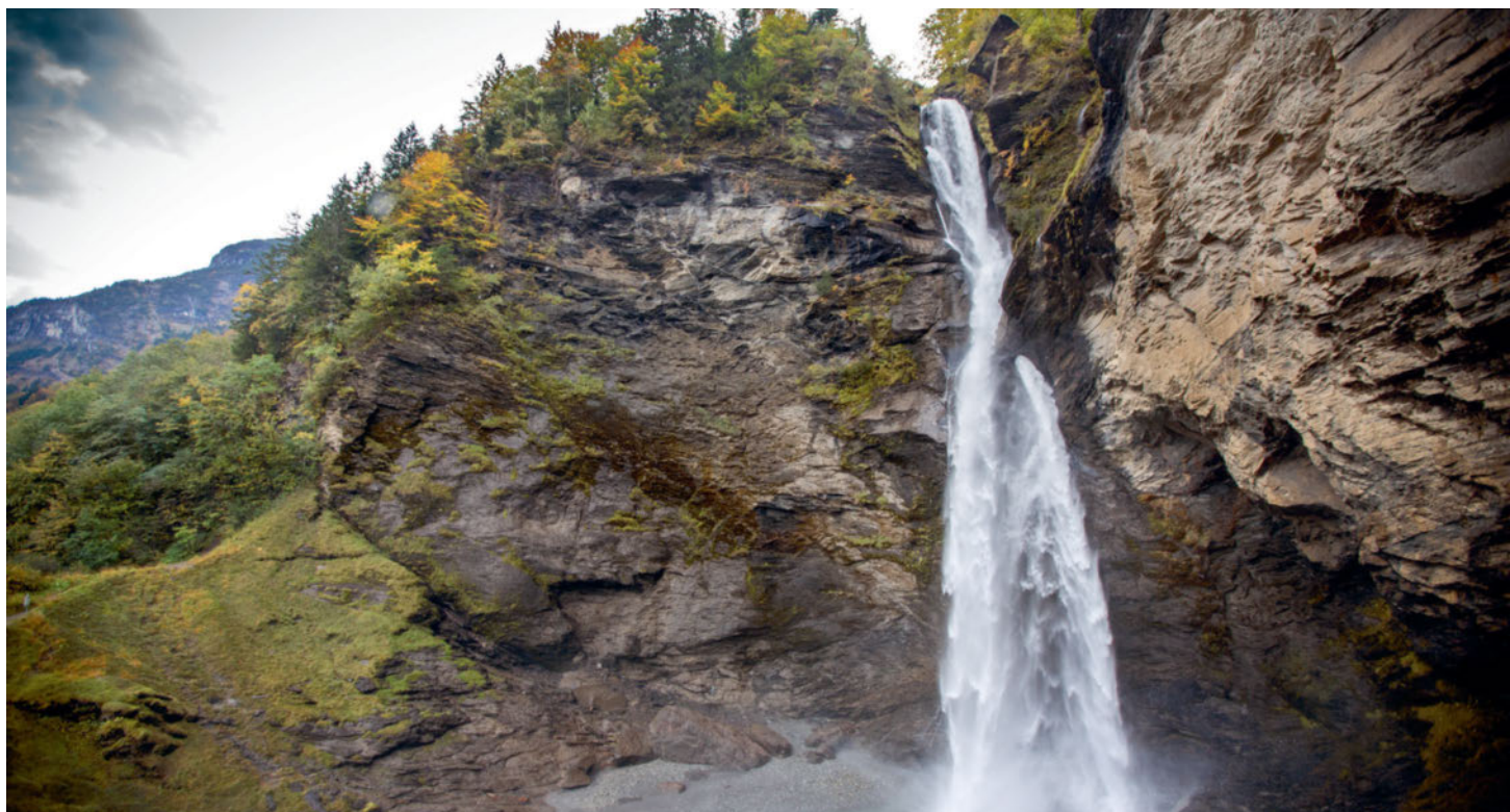
Le combat entre Sherlock Holmes et son ennemi juré, le professeur Moriarty, s'est terminé par une chute vertigineuse.

« C'est le coeur serré que je prends la plume pour tracer ces lignes, les dernières où je parlerai jamais des dons singuliers qui faisaient de mon ami Sherlock Holmes un être d'exception. » C'est par ces paroles prononcées par le Dr Watson qu'Arthur Conan Doyle débute l'ouvrage Le dernier problème du célèbre détective Sherlock Holmes. Les fans de Sherlock Holmes savent que ce