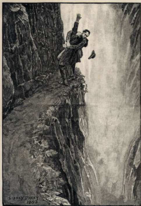
Ce dessin de Sidney Paget montre Sherlock Holmes et le professeur Moriarty engagés dans une lutte à mort. Illustration : Sidney Paget

montée passant devant le magnifique hameau de Schwendi, en direction de l'hôtel de Zwirgi. L'endroit où Sherlock Holmes aurait trouvé la mort se situe entre Schwendi et le barrage de Zwirgi, qui vaut également le détour. C'est ici qu'aurait eu lieu, le 4 mai 1891, le combat fictif entre Sherlock Holmes et son ennemi, le diabolique professeur James Moriarty, au cours