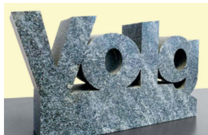
Le trophée « Magasin de l'année » en granit tessinois est décerné chaque année à des magasins Volg qui se sont distingués par des prestations supérieures à la moyenne.

Toutes les équipes des quelque 600 magasins Volg ont accompli des