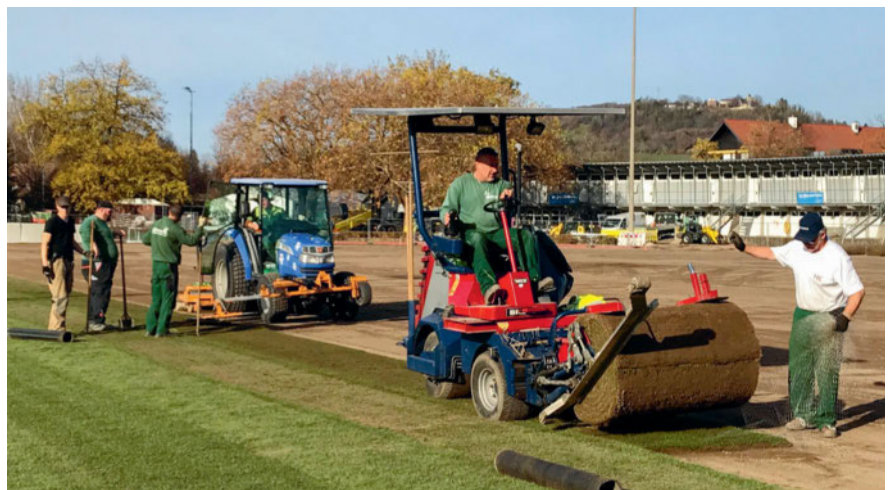
En 2020, le terrain de foot de Riehen a été recouvert d'un nouveau gazon de placage.

Une fois le gazon posé, celui-ci a besoin de temps et de soins attentifs pour résister aux multiples sollicitations que subit un terrain de foot. Or, dans le sport professionnel encore plus qu'ailleurs, le temps est une denrée rare. Aussi les stades de sport