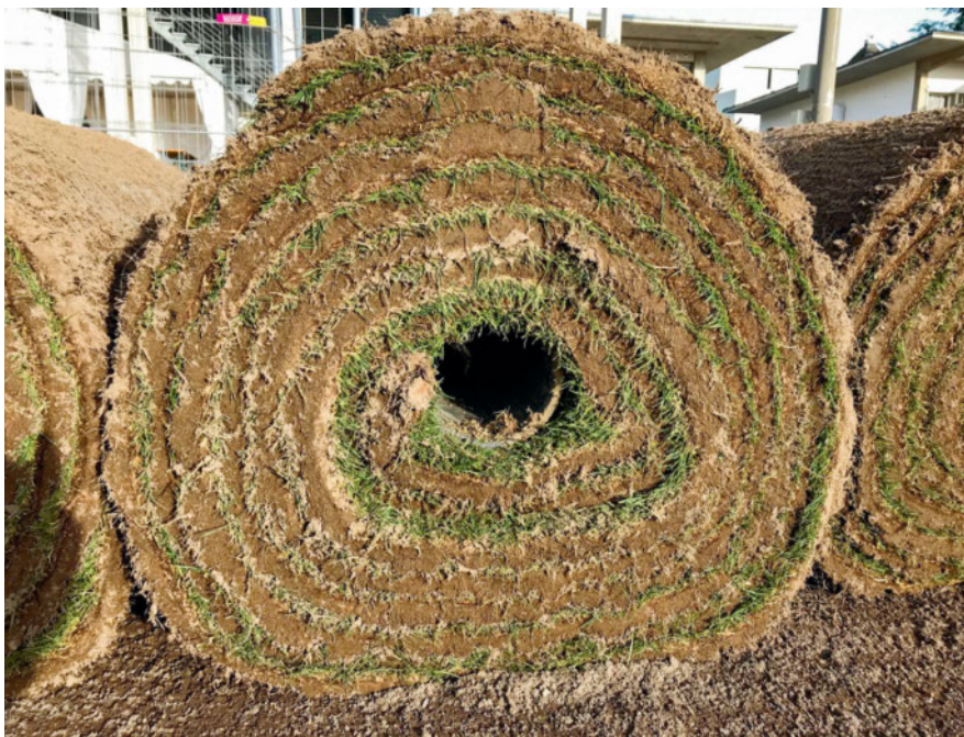
Le gazon de placage peut être posé tout au long de l'année.

optent-ils souvent pour des gazons de placage, en particulier dans les zones soumises à des conditions extrêmes, comme par exemple les buts, où un sursemis n'a pas assez de temps pour se développer. Dans ces situations, la culture du jeune gazon, qui requiert beaucoup de soins, est prise en charge par les producteurs de gazon de placage. Une fois posé, le gazon de placage n'a besoin que de trois semaines pour pouvoir être pleinement utilisé. Les privés et les entreprises de paysa-