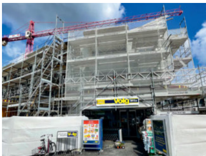
Jusqu'en automne 2022, le magasin Volg de Wila occupera un emplacement provisoire.

WILA/ZH Le magasin Volg de Wila a déménagé provisoirement. Désormais, les clients peuvent faire leurs achats à la Tösstalstrasse 31, directement derrière le site actuel. Volg y restera un an et demi. Le bâtiment accueillant actuellement le magasin Volg sera en effet détruit. Il fera place à une nouvelle construction abritant le nouveau magasin Volg, dont l'ouverture est prévue pour l'automne 2022. Grâce à ce déménagement provisoire, le magasin restera ouvert pendant toute la durée des travaux et la clientèle pourra donc continuer à faire ses achats au village. LANDI Wila-Turbenthal, dont Volg fait partie, attachait énormément d'importance à ce que ce soit le cas, de nombreux clients et clientes n'ayant pas de véhicule. Pour les responsables, la pandémie du coronavirus a également démontré l'importance des solutions alternatives régionales pour les achats. Le déménagement a toutefois été un défi important : l'emplacement provisoire étant deux fois plus petit, l'assortiment a dû être réduit momentanément. Mais ce n'est que partie remise : le futur magasin Volg sera même un peu plus grand et il offrira encore plus de place pour les produits régionaux. ■